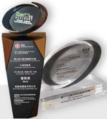
东头村第八期公共租住房屋发展计划建筑工程于公德地盘獎及傑出環境管理獎均獲得優異獎