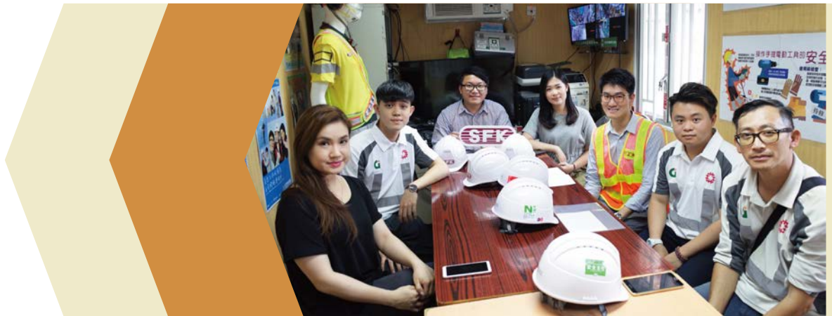
钻石山地盘的实习生分享参加计划的感受和得著