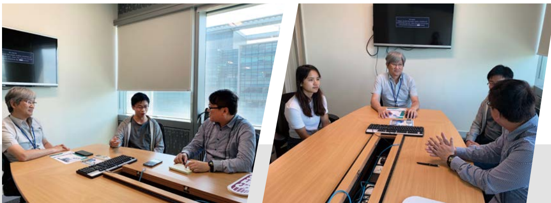
Build.IT的实习生分享参加计划的感受和得著