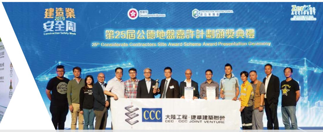
新福港合營公司大陸工程—捷章建築聯營的啟德發展計劃-前跑道南面發展項目的基礎設施工程第2期，於工務工程-新建工程組別中獲得公德地盤獎-優異獎，並於最佳模範分包商前線工地監工獎組別中獲得優異獎。